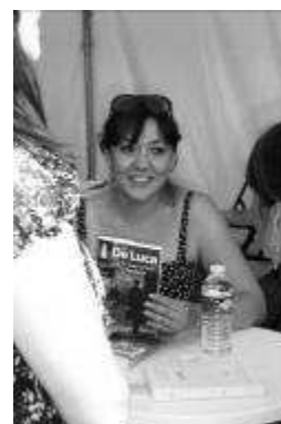
Bibliothécaire participant au speed booking de la Fête des Livres 2010

Bibliothécaires et libraires, avec leur regard de professionnels et de passionnés de la lecture, font partager au public leur « coup de cœur littéraire ». Ainsi, pendant quelques minutes, les œuvres des auteurs invités s'animent.