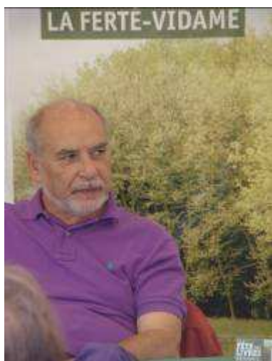
Tahar Ben Jelloun, auteur invité en 2010 pour son ouvrage Sur ma mère ,