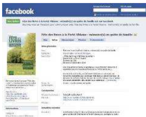
Page Facebook de la Fête des Livres 2010

La presse locale relaie également l'information. La presse nationale est tenue informée de cette manifestation dans les délais suffisants pour les parutions de l'été, avec la volonté de chercher à donner une envergure nationale à une manifestation départementale reconnue. La revue de presse des éditions précédentes est à votre disposition sur demande.