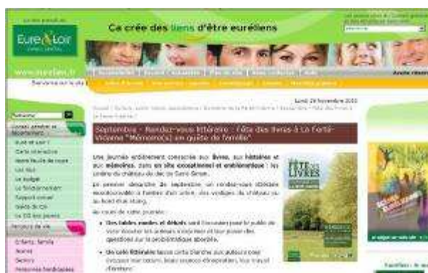
Page de la Fête des Livres sur le site du Conseil général d'Eure-et-Loir