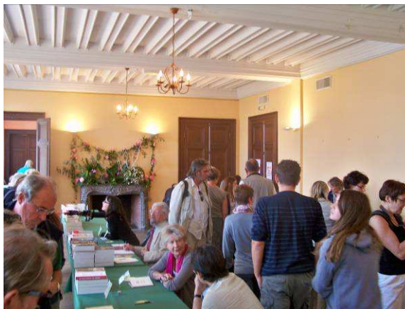
Séances de dédicaces dans la librairie, 2010