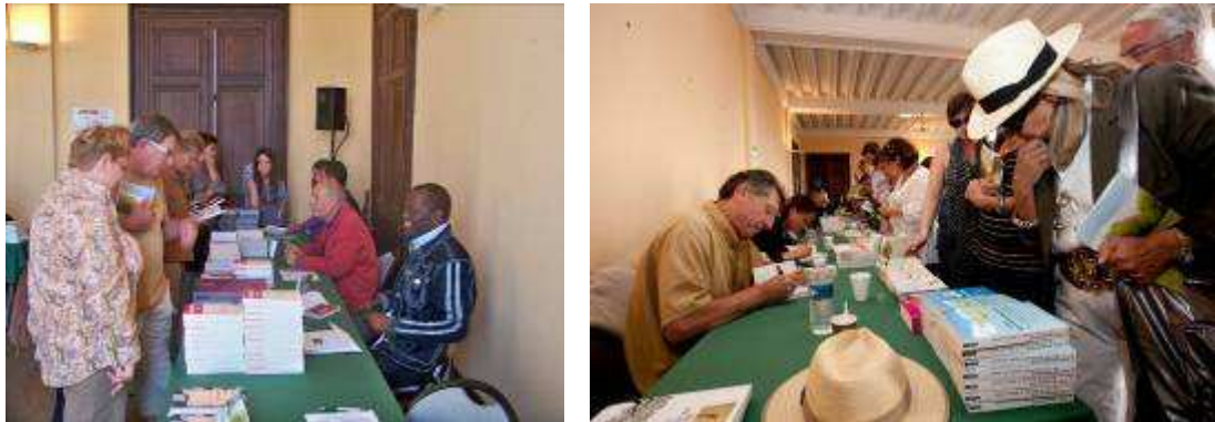
Séances de dédicaces dans la librairie en 2010 : de gauche à droite, Tahar Ben Jelloun, Alain Mabanckou, Denis Grozdanovitch

Rassemblant les auteurs présents pour échanger avec les publics et dédicacer leur dernier ouvrage, la librairie de la Fête des Livres constitue un lieu privilégié de rencontres.