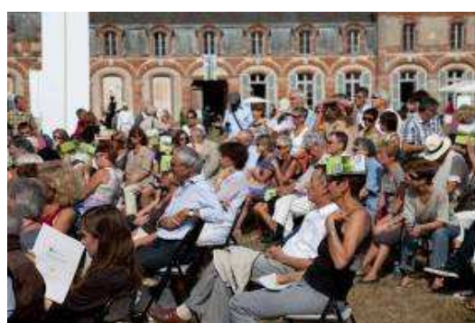
Public nombreux et attentif aux tables rondes, 2010

L'accessibilité du salon au plus grand nombre demeure le principal objectif. C'est pourquoi la programmation de la journée s'adresse à tous les publics. Adultes, enfants ou adolescents, visiteurs des environs ou de plus loin, tous trouveront à satisfaire leur désir de lecture et de culture.